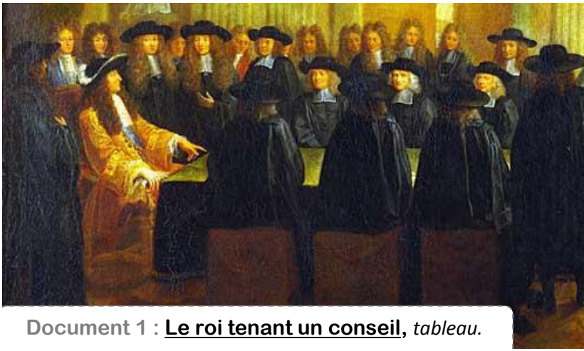
Document 1 : Le roi tenant un conseil , tableau.