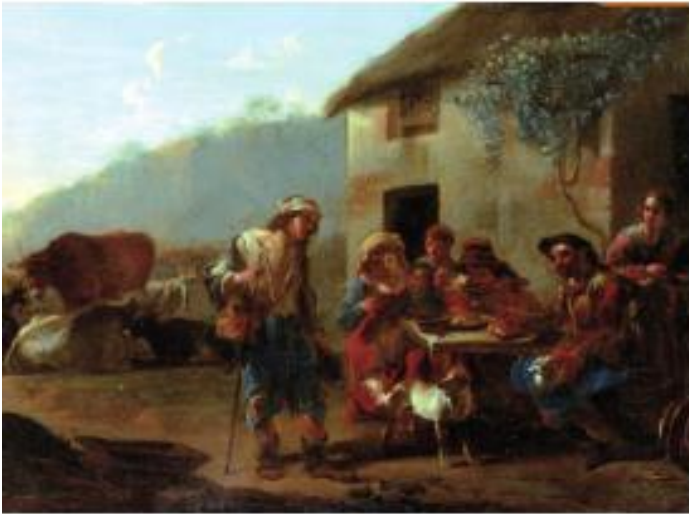
Document 3 : Le mendiant , tableau de Jan Miel