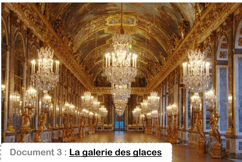
Document 3 : La galerie des glaces