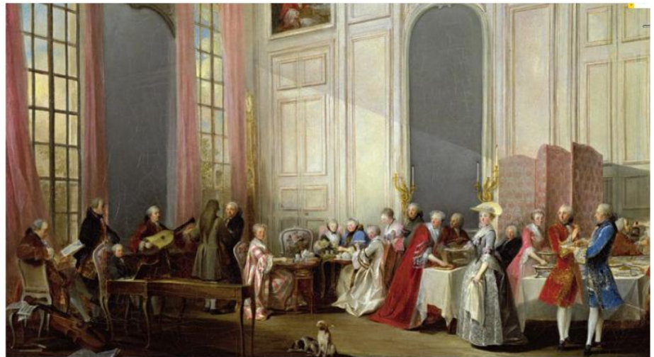
Document 4 : Le thé à l'anglaise , tableau de Michel Barthélemy Ollivier

10 Compare cette situation à celle du tableau au-dessus.