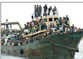
L'Union européenne attire aussi les touristes et les entreprises.

Grâce à la richesse de son patrimoine historique et à la diversité de ses paysages, l'Union européenne est la première destination touristique du monde. La France, l'Italie et l'Espagne sont les trois premiers pôles touristiques mondiaux. Le nombre de touristes y dépasse celui des habitants à certains moments de l'année.