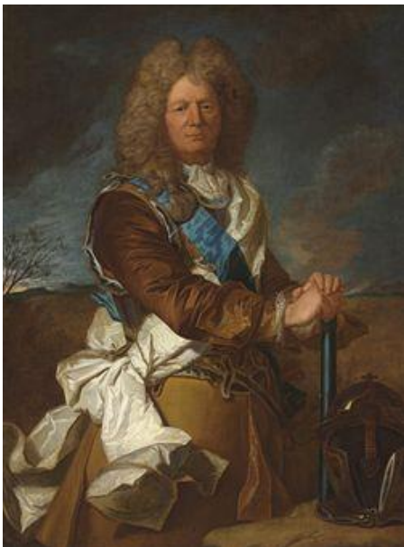
Vauban peint par Hyacinthe Ribaud

règles à revoir : ce/se ; ces/ses ; c'est/s'est