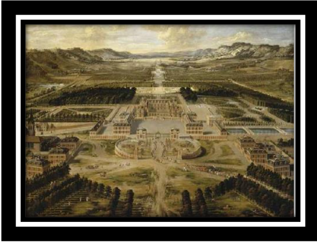
Vue du château et des jardins de Versailles, prise de l'avenue de Paris en 1668, par Pierre Patel, XVII e siècle.

Huile sur toile, 115 x 161 cm, Château de Versailles, MV 765.