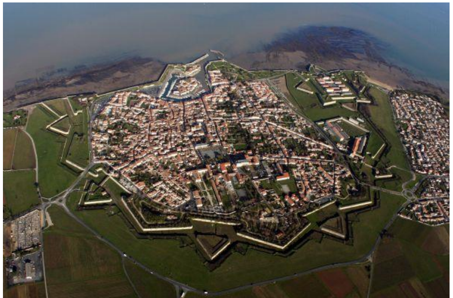
Citadelle Saint Martin en Ré, île de Ré, France