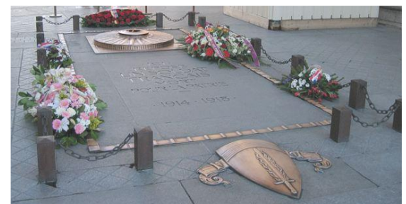
La tombe du soldat inconnu