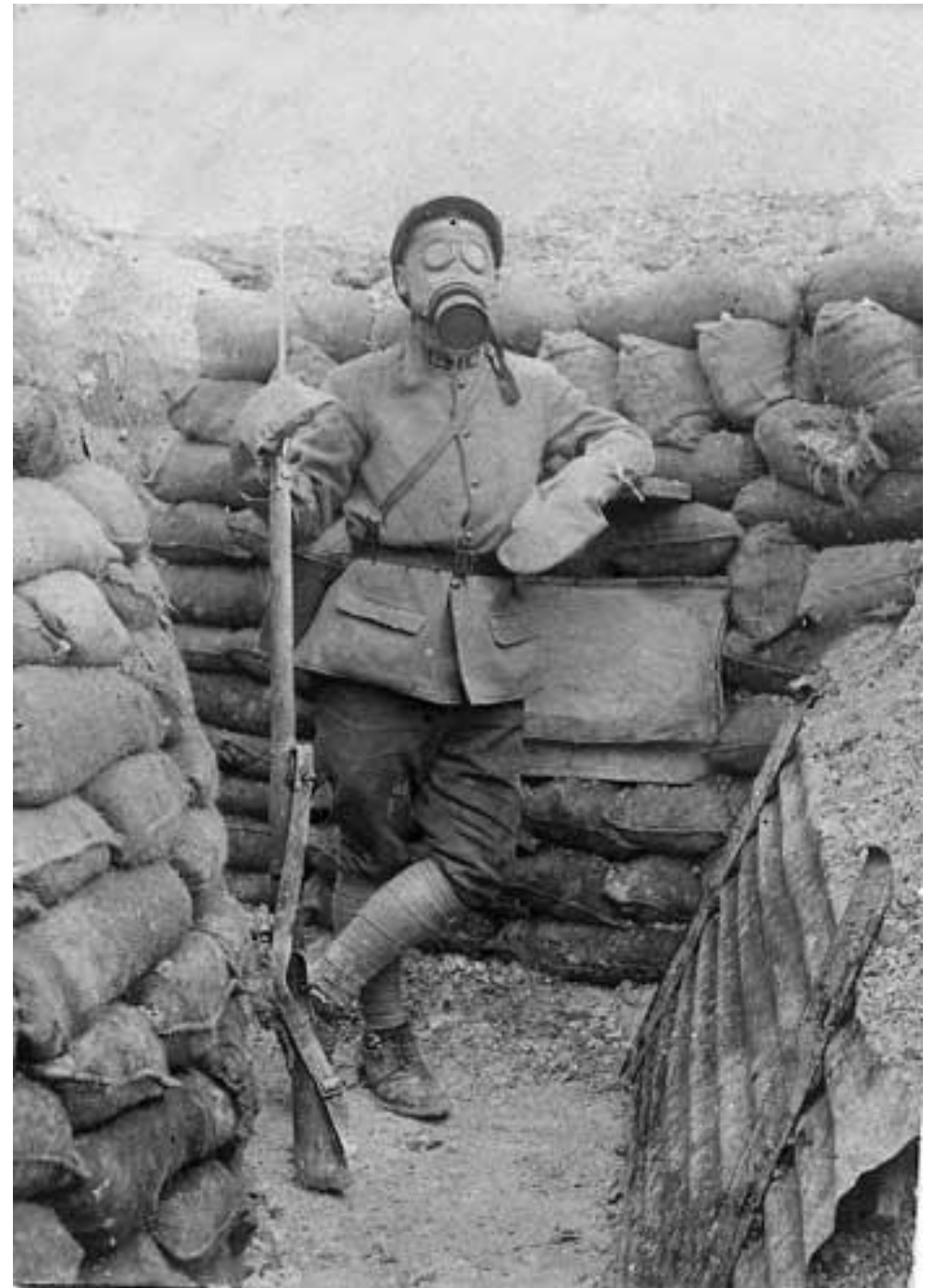
Tranchées de la 1 ère guerre mondiale