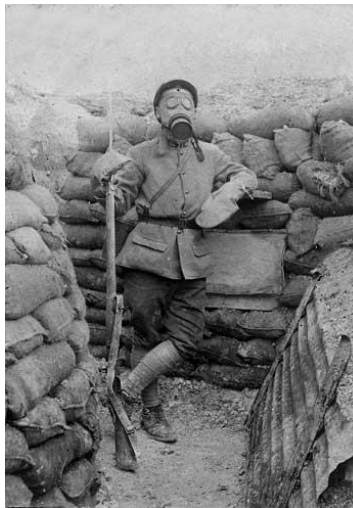
Dans les tranchées

A Paris, le président de la République dépose des fleurs sur la tombe du soldat inconnu, mort à Verdun*, qui se trouve sous l'arc de triomphe. Ce soldat français représente tous les soldats morts pendant la guerre.