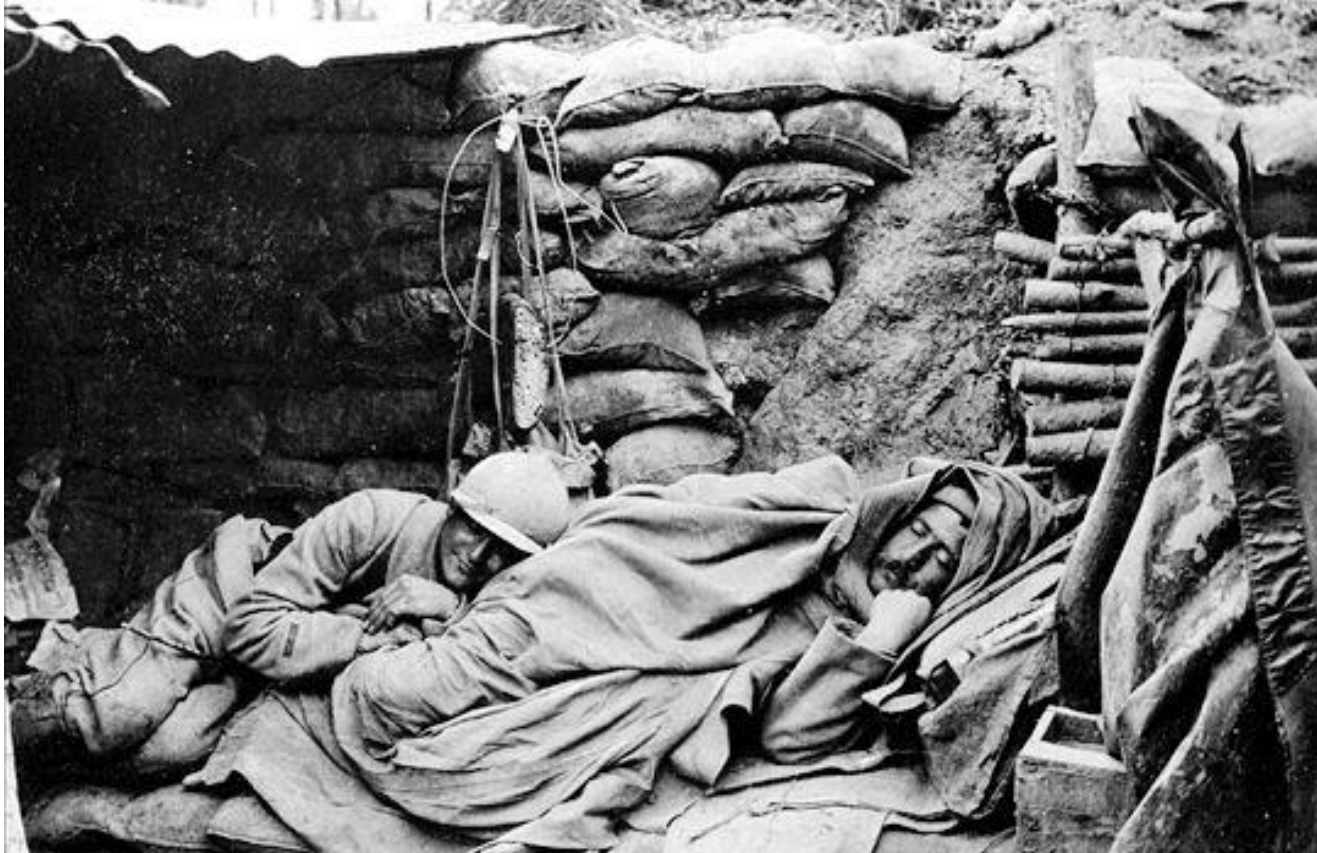
Tranchées de la 1 ère guerre mondiale