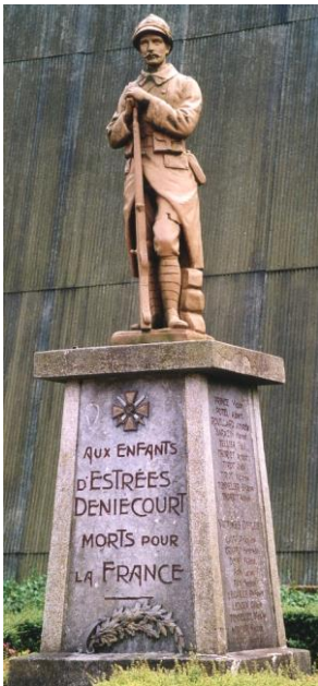
Monument aux morts

Depuis 1922, le 11 novembre est une fête nationale.